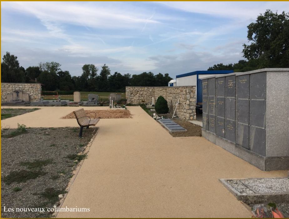
Les nouveaux columbariums