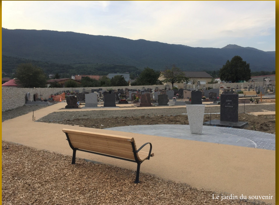
Le jardin du souvenir