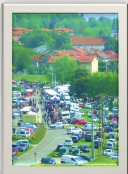
Fête du printemps 14 mai 2017 (vue hélicoptère)