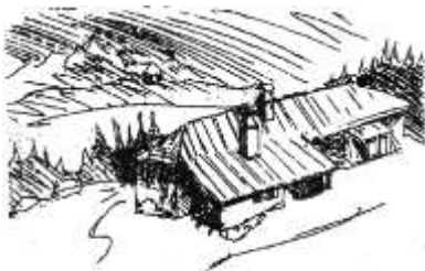
Chalet du Gralet 1450 m d'altitude 01630 Péron